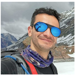
CREADOR. Disi promueve literatura de montaña chilena, porque hoy casi todo es de origen extranjero.